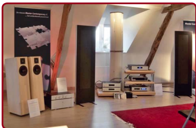
DYNAMIC SOLUTIONS EN AUDIONORD EUROPE